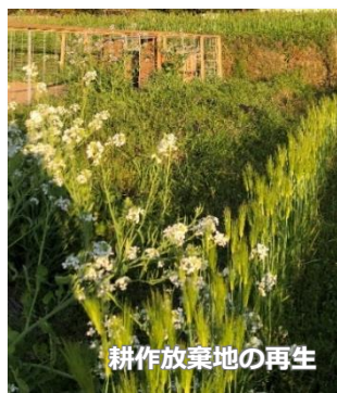
耕作放棄地の再生