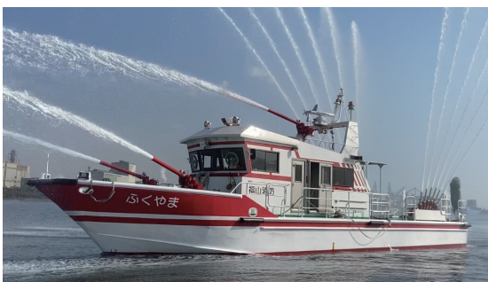
消防艇 船の火事や油の流出事故のときに、出動します。