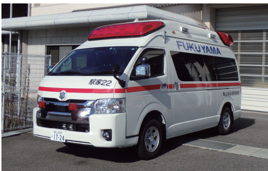
救急車 火事や交通事故などでけがをした人、急病の人に必要救命処置をしながら、病院へ運びます。