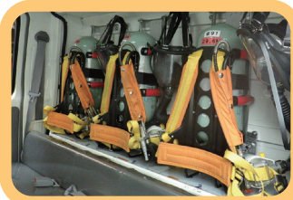
くうき こきゅうき 空気呼吸器

また、PA連携といって、救急現場にも消防車が出動し、救急活動を助けることがあります。