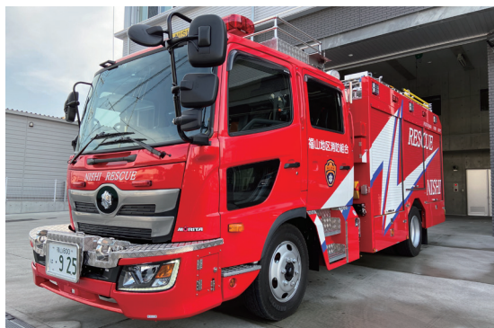
救助工作車 交通事故や水の事故のときに、救助資機材を使い、けがをした人を助け出します。