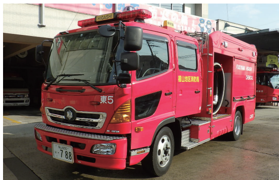
化学車 ガソリンなどの危険物による火災で、特殊な消火薬剤を使って火を消します。