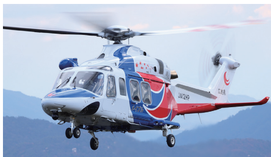
広島県防災ヘリコプター「メイプル」 山火事を消したり、山間部や離島の急病の人を病院へ運んだりします。