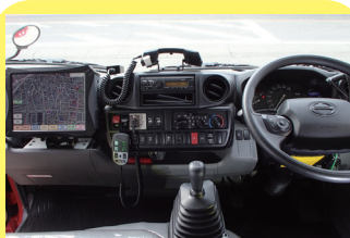
うんてんせき 運転席