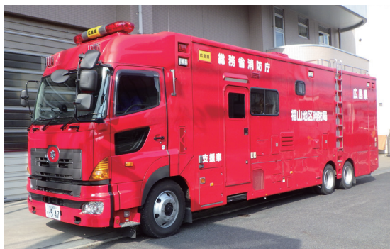
支援車 大規模な地震・台風などの災害が起きたときに、現場で情報収集・分析・連絡・指揮をする車両です。