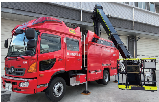
ポンプ車 ポンプがついている車両で、ホースをつなげて放水活動を行います。