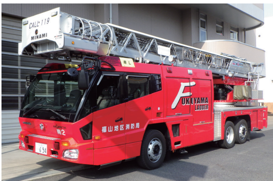
はしご車 ビルが火事になったときに、人を助けたり、火を消したりします。