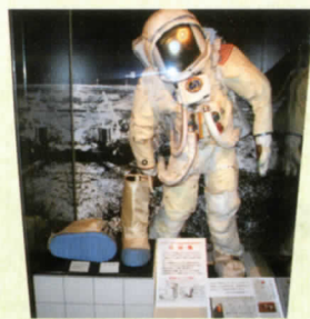
宇宙のはきもの ルナブーツ(月面靴・複製)