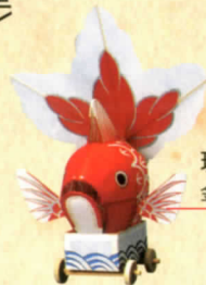
玩具の樹 金魚台輪(新潟県)