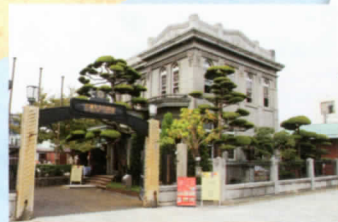
旧マルヤマ商店事務所 国登録有形文化財