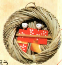
節句を祝う 流しびな(鳥取県)