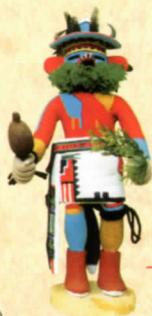
世界の玩具 カチナ人形 (アメリカ合衆国) (国内最大のコレクション324点収蔵)