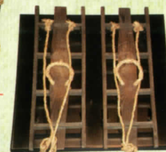
労働とはきもの 大足(田下駄の一種)