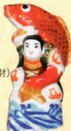
ふるさとの玩具 常石張り子 (製作技術:市無形文化財)