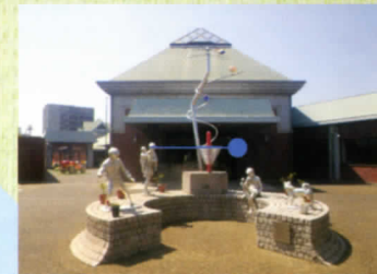
モニュメント「遊遊」 松岡高則 作