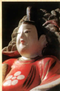
天神さま 松負い天神(広島県)