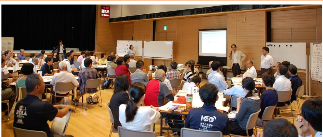
グループでの話し合い結果を発表した後、全体で話し合いました