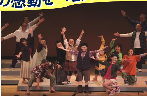
リーデンローズでの上演の様子(2014年11月2日)