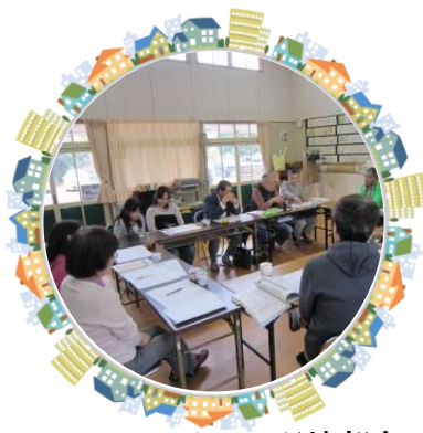
コミュニティ・環境部会