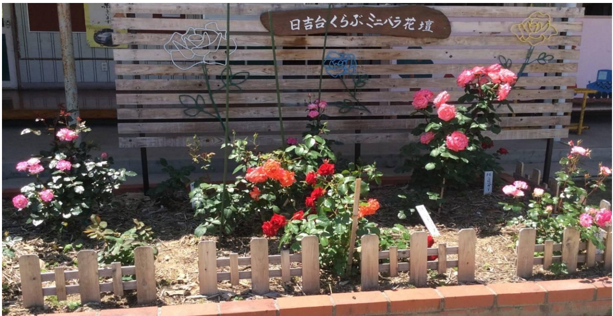
2014（平成26）年6月 日吉台くらぶ（休園中の日吉台幼稚園）に住民と行政で造成したばら花壇

アンケート調査や住民学習会等のあらゆる機会に、地域住民のみなさんから思いや願いを伺いました。寄せられた様々な声を真摯に受け止め、活動の現状を整理し、将来に向けて課題を解決していく行動を「日吉台学区まちづくり計画」として取りまとめました。