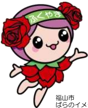
福山市 ばらのイメージキャラクター「ローラ」