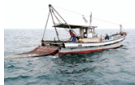
小型機船底曳網漁業