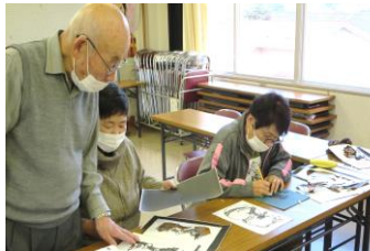
切り絵の年賀状づくり