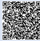
電子申請システム (夢の応援コース)