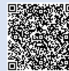
電子申請システム (未来づくりコース)