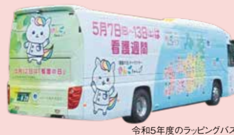
令和5年度のラッピングバス

10:00~ 出発式(県庁前) 10:35~ 「看護の出前授業」 広島市内の小中学校にて 12:00~14:00 「まちの保健室」 イオンモール広島府中にて 14:00~ PRバスまちなか巡回