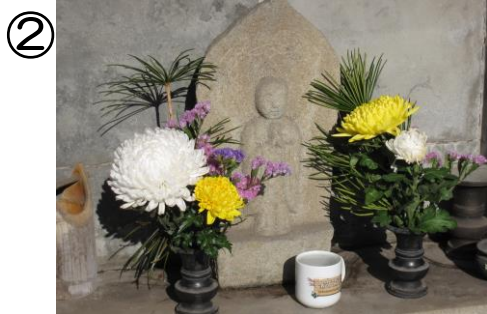
昔の人たちの休憩所として東西南北に作られていたもの。