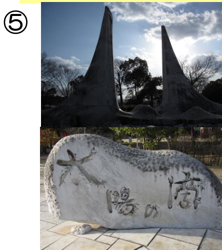
杭谷一東 作 “太陽の滴”