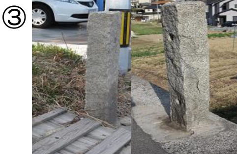
お祭の際に使用されていたものよう。