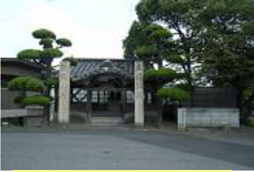
②塩崎神社：神社に続く新土手には桜並木があります。