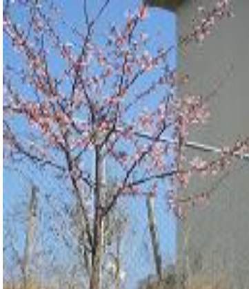
④小学校：春真っ先に咲く河津桜があります。