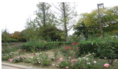
⑥春日池公園内にあるバラ園 甘い香りにつまれ、リラックスした一時を楽しむ