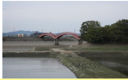
⑨浦島橋：朱塗りの美しいめがね橋 幻想的な菖蒲畑へとつながる