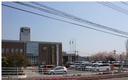
②東部市民センター 東部地域の拠点支所・図書館・ホール等がある