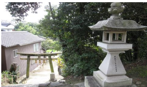
⑪春日神社：東部地域が一望できる高台にあり、多くの人を訪れる