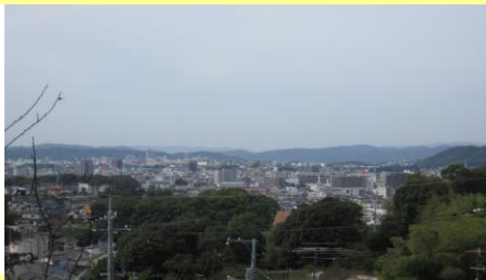
⑪春日神社付近から見た眺望 産業とともに発展した新しい町並み