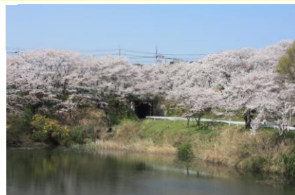
⑬雑司池：春は桜の名所 緑豊かな伊勢丘のオアシス