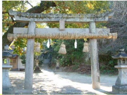
③ 吉田巖島神社：大きな鳥居をくぐり階段を登ると、本殿・拝殿がある。