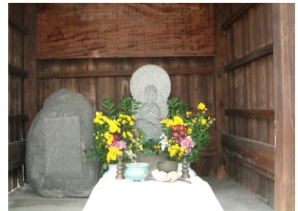
⑫ 前古屋観音：馬頭三面観世音堂といわれ、西国33番霊場の内29番。