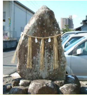
⑧ 地神：近所の人達が五穀豊穡・家内安全を祈願している。