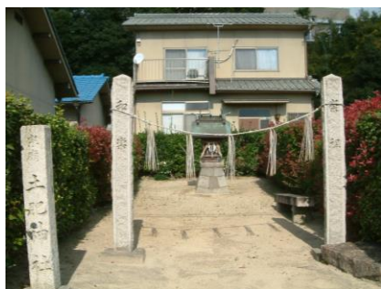
⑪ 土肥神社：神社の周りには、土肥の名字の家が多く見られる。