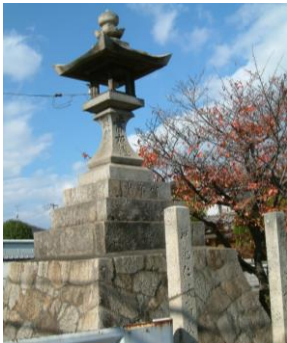
⑨ 高崎常夜燈：左右には、金比羅大権現と聰敏明神と刻まれている。