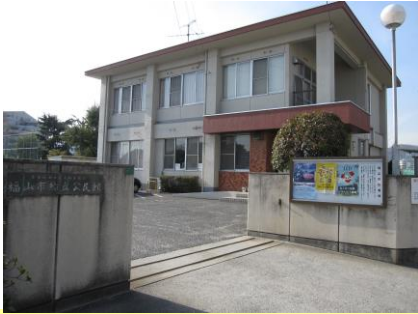
① 緑丘交流館からスタート!!