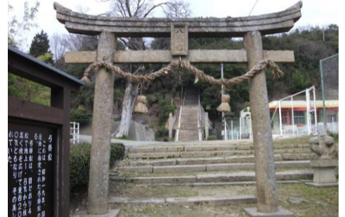
⑥こども園のとはら隣の八幡神社