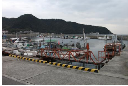
②交流館前の波止場