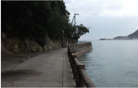
④阿伏兔観音までの道