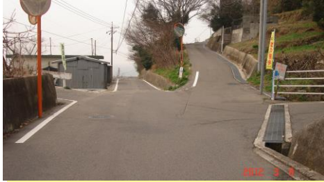
①団地の下の五叉路を越えると