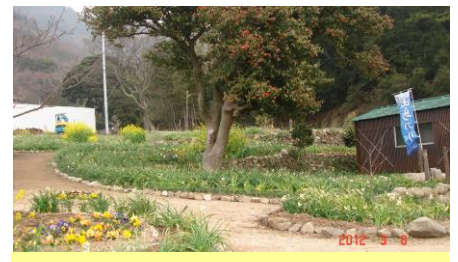
③癒しの空間 「やぶ椿と水仙里」!