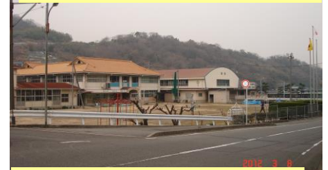
⑥旧内浦小学校跡まで帰って きました。