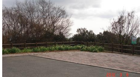
⑤長坂展望台。 眼下に見下ろす海の景色は最高!