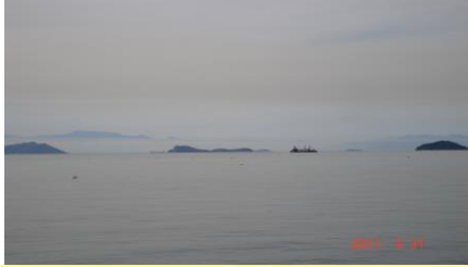
④天気の良いときは四国まで みえます。