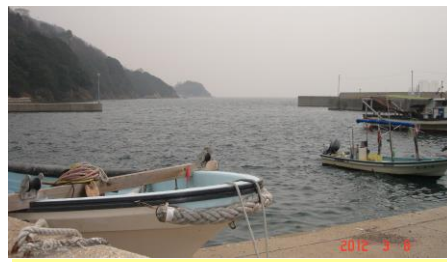
②小用地の漁港に出ます。