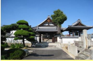
①光円寺 この地に入った開拓農民の教化のため、水野氏が中条から移した寺です。