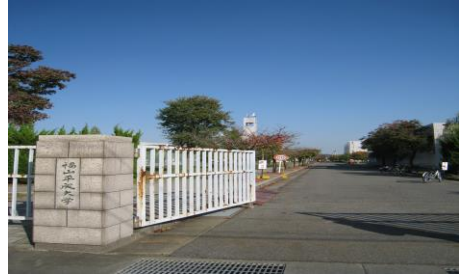
③福山平成大学 平成6年4月に開校した大学です。