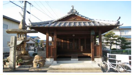
⑥石鎚神社 石鎚講中の人々によって建てられた神社です。