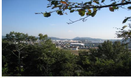
⑤正戸山頂上からの眺め 晴れた日には、御幸平野の四季が楽しめます。