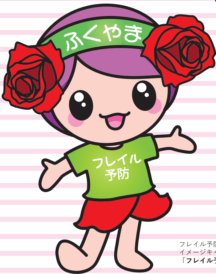
フレイル予防 イメージキャラクター 「フレイル予防ローラ」