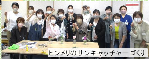
ヒンメリのサンキャッチャーづくり

我こそは伊勢丘小町という 方なら、どなたでも参加で きます。(自己申告制) 楽しみながら交流の輪を 広げましょう!