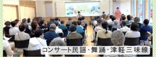
コンサート民謡・舞踊・津軽三味線