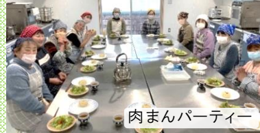
肉まんパーティー