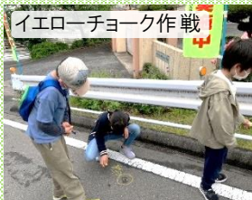
イエローチョーク作戦