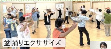
盆踊りエクササイズ

我こそは伊勢丘小町という 方なら、どなたでも参加で きます。(自己申告制) 楽しみながら交流の輪を 広げましょう!