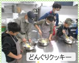
どんぐりクッキー