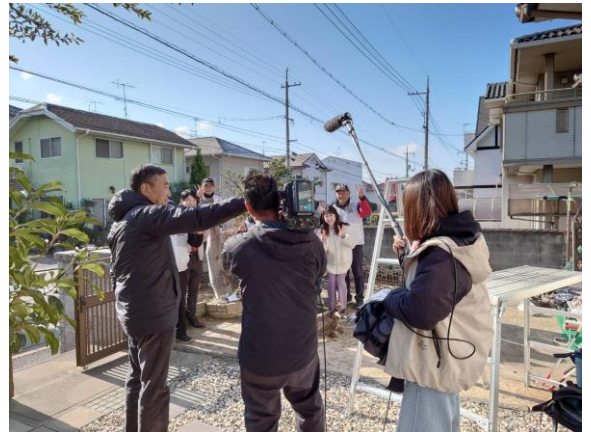
お天気にも恵まれた撮影日 気持ちよく取材が進みました。

※放送日：2月25（日）11時24分～30分 RCC放送「ピース！ピース！ふくやま」 ぜひご覧ください。