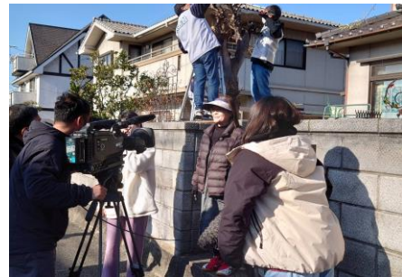
緊張した面持ちでインタビュー を受ける依頼者さん。