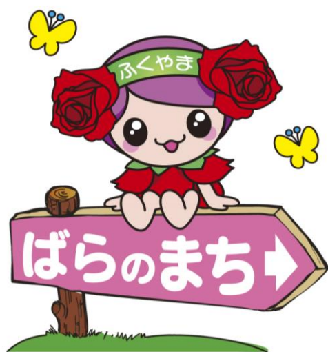
ばらのまち福山 イメージキャラクター「ローラ」

改訂／2023年度（令和5年）12月 福山市 保健福祉局 長寿社会応援部 高齢者支援課