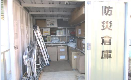
防災倉庫の点検・整理 (2024. 1. 20)

新年早々に起こった能登半島地震は、私たちに大きな衝撃を与えました。しかし、いつでもどこでもこのような災害が起こり得るのは周知のことです。家族で話し合うなど、身近なところから備えていきましょう。