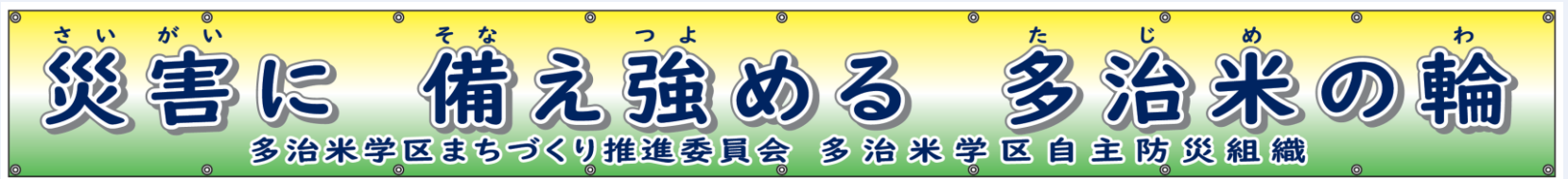
横断幕を設置 (2024. 2)