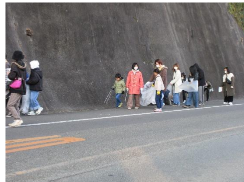
年末クリーン作戦