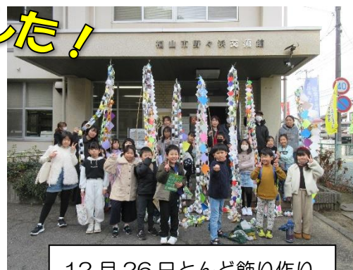
12月26日とんど飾り作り

ふれあい委員会主催で、「しめ縄教室」と「とんど飾り作り」を開催し、たくさんの方が参加されました。