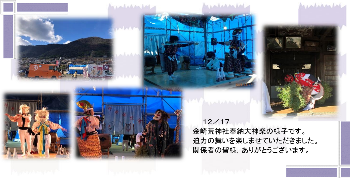
12/17 金崎荒神社奉納大神楽の様子です。 迫力の舞いを楽しませていただきました。 関係者の皆様、ありがとうございます。