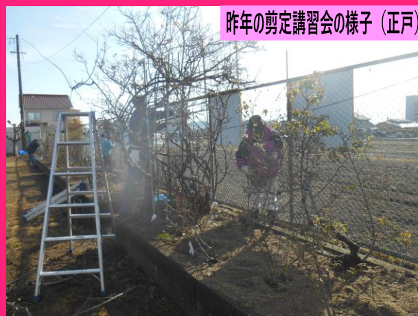
昨年の剪定講習会の様子（正戸）