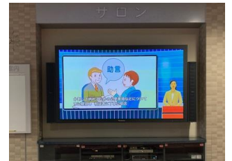
行政相談マスコット キクーン