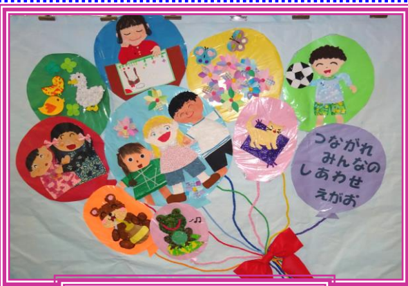
児童生徒人権平和作品展の作品

日本では、毎年12月10日を最終日とする一週間を「人権週間」と定めています。この時期には各地で人権・平和について考える、さまざまな行事や学習会が開催されています。福山市では毎年、人権週間に合わせて「ふくやま人権・平和フェスタ」や、市役所本庁舎や各支所などで「児童生徒人権平和作品展」を開催しています。西部市民センター サロンでも子どもたちの作品を展示します。作品にこめられた思いを考えてみませんか。