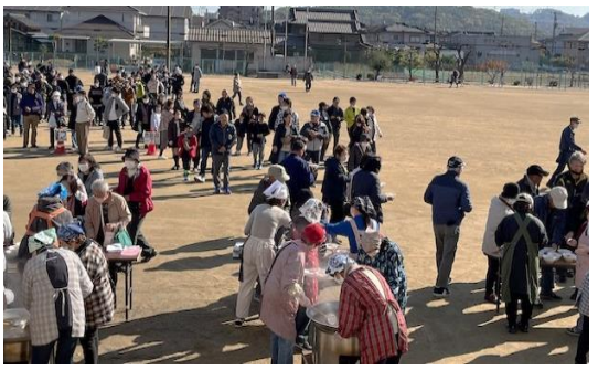
炊出し訓練の様子