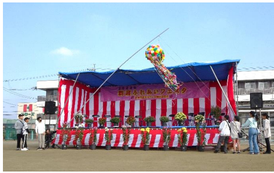
開会式 くす玉わり