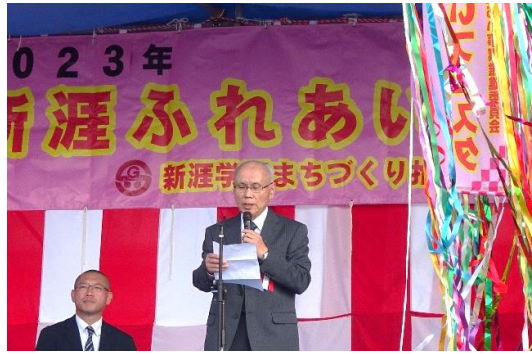
開会式 実行委員長挨拶

今後とも、明るく住みよい笑顔あふれるまちづくりのために、ご理解ご協力よろしくお願いいたします。