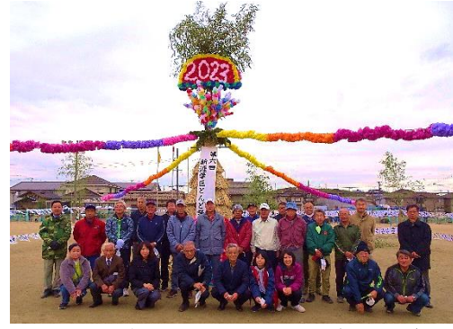
2023年1月のとんど祭の様子