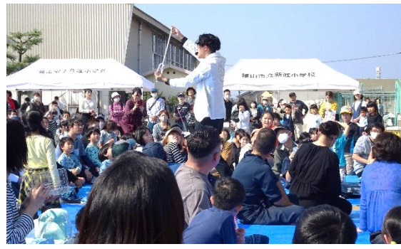
メインステージ S4さんによる大道芸