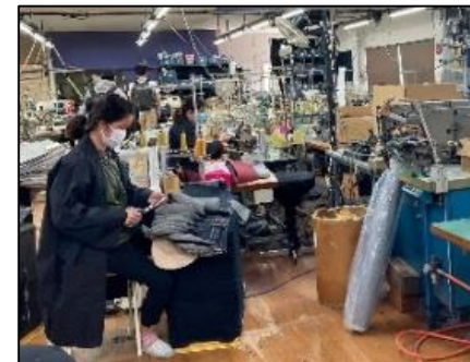
デニム製造の工程見学