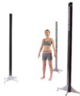
3Dボディスキャナーのイメージ