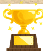
第64回福山市少年少女親善球技大会