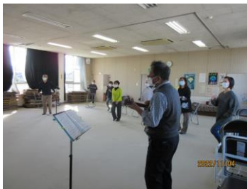
駅家東公民館（当時）