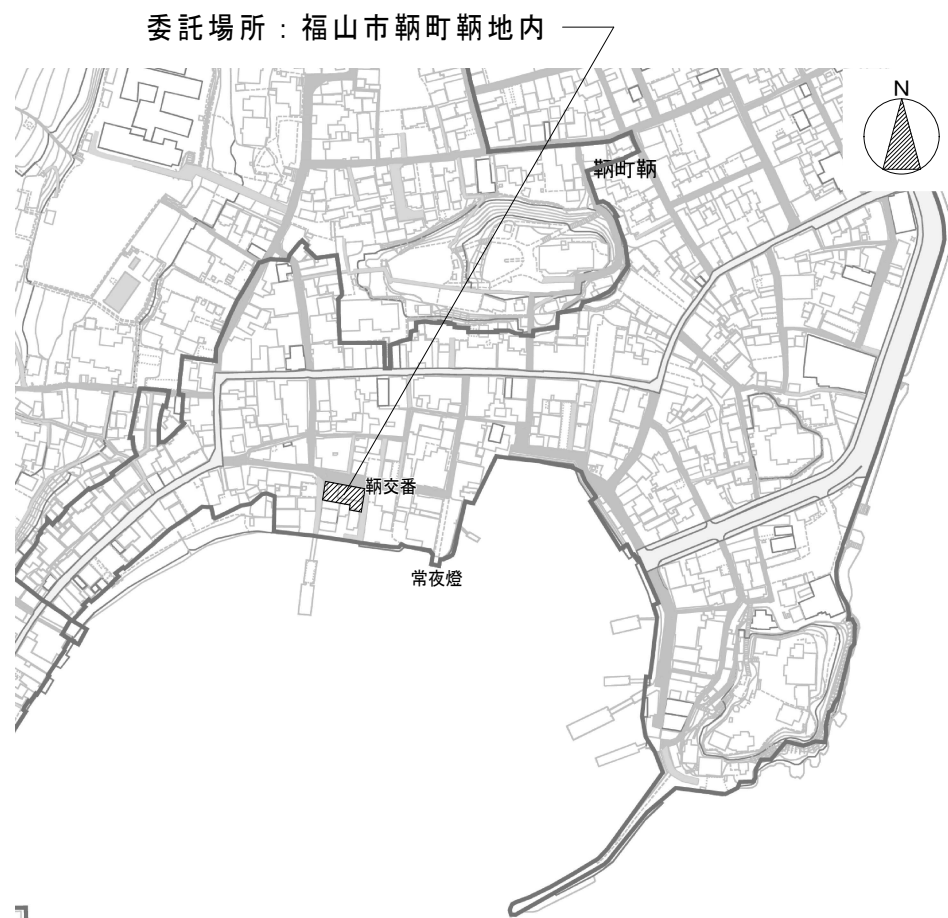
付近見取図 Non Scale