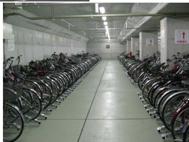
福山駅南自転車駐車場(地下部分)