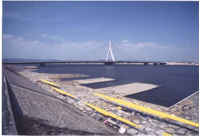
都市計画道路 神辺水呑線(芦田川大橋)

2009年(平成21年)4月1日現在、都市計画道路として108路線、総延長279,470mを決定し、整備率は約62%となっています。