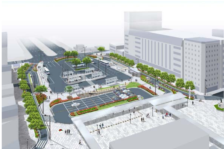
福山駅前広場整備イメージ図 【イメージ図であり変更する場合があります】

駅前広場は、鉄道、バス、タクシー、一般車など、各種交通機関の結節点として機能するとともに、都市における市民交流の場として位置付けられ、都市の玄関口としても、都市景観上、大きな役割を持っており、交通広場として、JR山陽本線の福山駅、東福山駅、松永駅及びJR福塩線・井原鉄道の神辺駅に設けています。