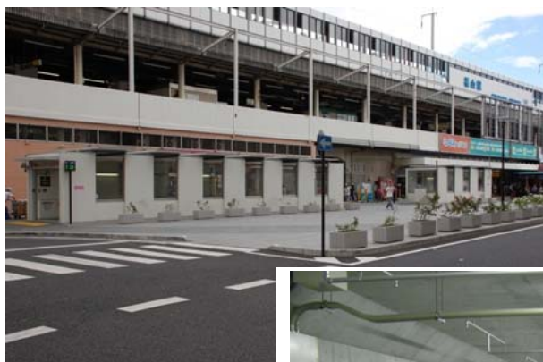
福山駅南自転車駐車場 (地上部分)

このため、1990年(平成2年)に福山市自転車等の放置の防止に関する条例を制定し、放置禁止区域を指定するなどして、放置自転車の排除に努めるとともに、都市計画駐車場(自転車)として、1990年(平成2年)に東福山駅北自転車駐車場を整備し、2006年(平成18年)には、福山駅南に収容能力737台の有料自転車駐車場を整備しています。