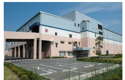
箕沖ごみ固形燃料化施設

の積極的活用を図るため、箕沖町のリサイクル発電施設に隣接して新たに RDF(ごみ固形燃料)化方式によるごみ処理施設を 2001 年(平成 13 年)10 月に都市計画決定し、2004 年(平成 16 年)4 月から稼動しています。