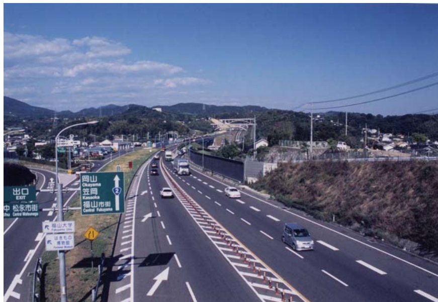
都市計画道路 福山尾道三原線(松永道路)

福山市では、当初 1937 年(昭和 12 年)に福山都市計画街路を決定し、整備を準備中でしたが、戦災により中断されました。戦後、国の方針として恒久的復興計画を立案することとなり、抜本的な検討が行われた結果、戦後の社会情勢の大幅な変動に対応するため、従来の街路計画を白紙に返した全く新しい構想によって定めることとなり、1946 年(昭和 21 年)10 月復興計画の樹立に伴って新たな街路計画を決定すると同時に従前の計画については、全