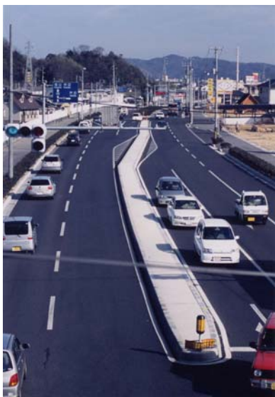
都市計画道路 新市駅家線 (一般国道 486 号)

更に、新都市計画法により、1973 年(昭和 48 年)3 月 9 日備後圏都市計画区域が決定され、備後 4 市 7 町を一体の都市として、総合的な都市計画を行うことになり、備後圏全体の道路名称(番号)を 1976 年(昭和 51 年)7 月に変更しました。都市計画道路の整備は、事業の認可(旧法では事業の決定)を受けて施行されるようになり、1973 年(昭和 48 年)4 月 5 日には特に市民の念願であった入江大橋、続いて 1976 年(昭和 51 年)4 月 7 日に河口大橋、1980 年(昭和 55 年)10 月 1 日に水呑大橋、2003 年(平成 15 年)3 月 20 日に芦田川大橋が完成しました。