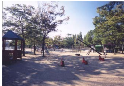
メモリアルパーク