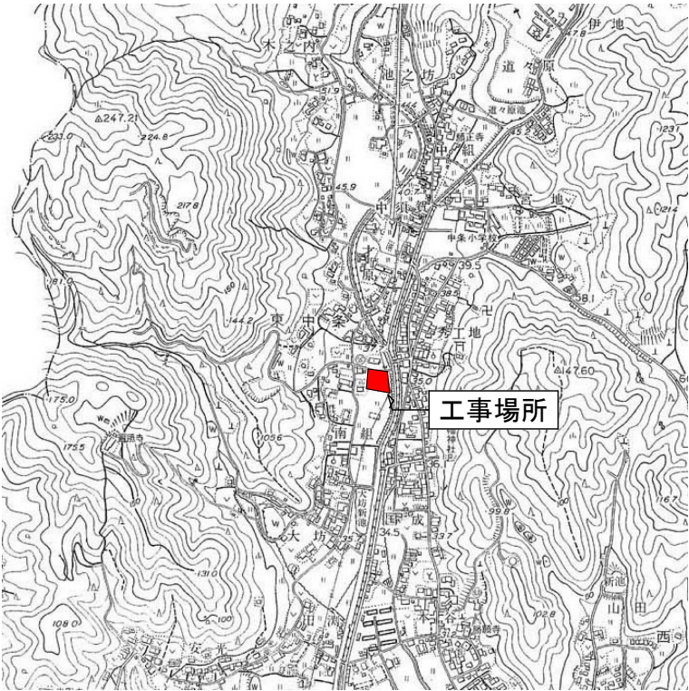
付 近 見 取 図