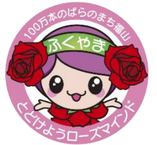
玫瑰之城福山 形象大使 “劳拉”