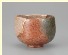
樂宗入《赤樂茶碗 銘老菜子》

夏季所蔵品展 ワレモノ注意！ 一美術の世界の「ワレモノ」たち 6月29日(木) - 9月3日(日)