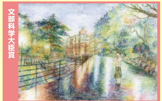
《8月9日雨の下での祈り》吉原立夏 中1 長崎市・アトリエ・ポポロ（長崎県）