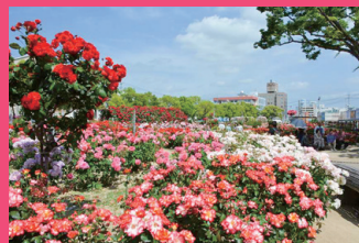
ばら公園 Rose Park