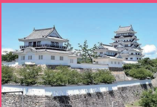
福山城 Fukuyama Castle

アイコンから探したい ジャンルを選択！ Choose the genre you want to search for with icons!