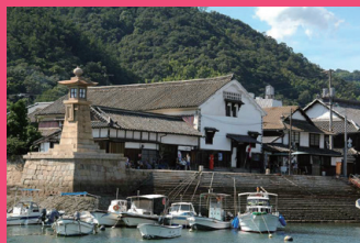
鞆の浦 常夜灯 Tomonoura Joyato