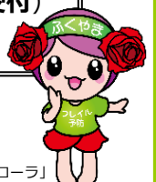
「フレイル予防ローラ」