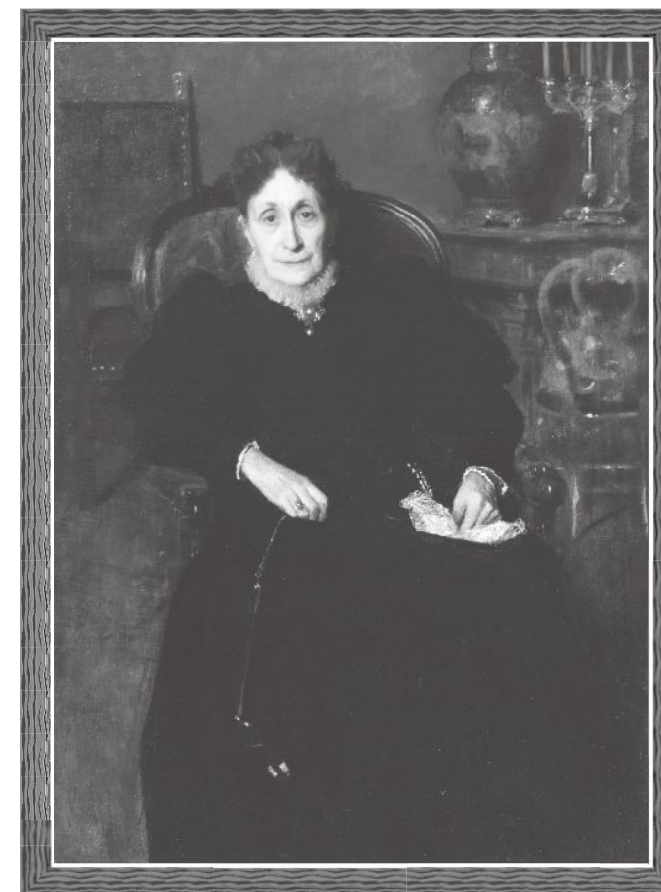
ジョヴァンニ・セガンティーニ《婦人像》1883～84年 ふくやま美術館蔵