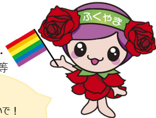
ばらのまち福山 イメージキャラクター 「ローラ」