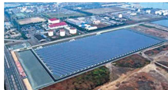
太陽光発電システムの設置 福山太陽光発電所【メガソーラー】