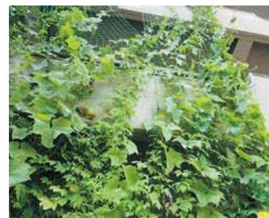
緑のカーテンの設置

また、この目標を達成するために「家庭・地域・学校」や「事業所」、「市役所」が力を合わせて、自分にできることから始める地球温暖化防止に取り組んでいます。