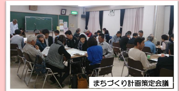
まちづくり計画策定会議