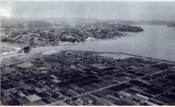
昭和36年(1961年)の曙町(当時新涯一番)