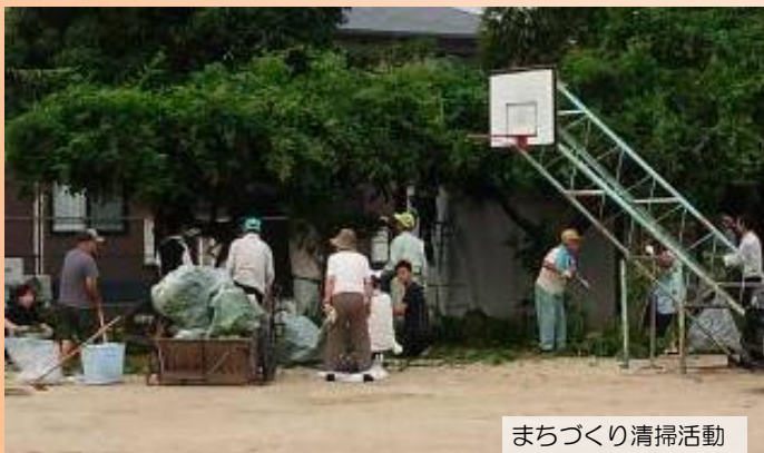
まちづくり清掃活動