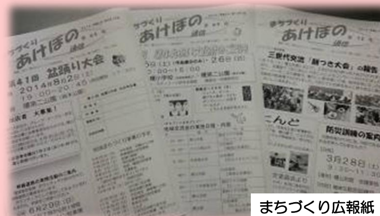
まちづくり広報紙