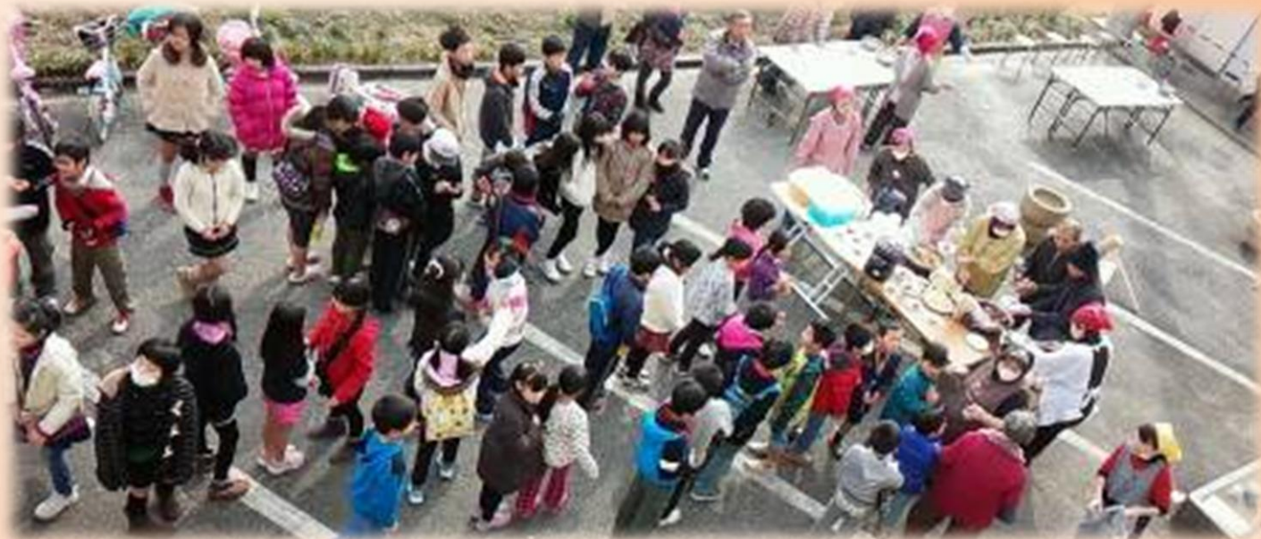
世代間交流事業の様子

「まちづくり計画」とは・・・私たちの地域の歴史や地域の課題などを再確認し、これからの学区のめざす方向性や具体的な取り組みをまとめたものです。曙学区では2014年度「まちづくりアンケート」を実施し、その後まちづくり推進委員会でテーマごとに議論し「曙学区まちづくり計画」を策定しました。今後は、この計画に基づき事業を実施していき、誰もが住みやすい曙学区の実現に向けて様々な取り組みを進めていきます。