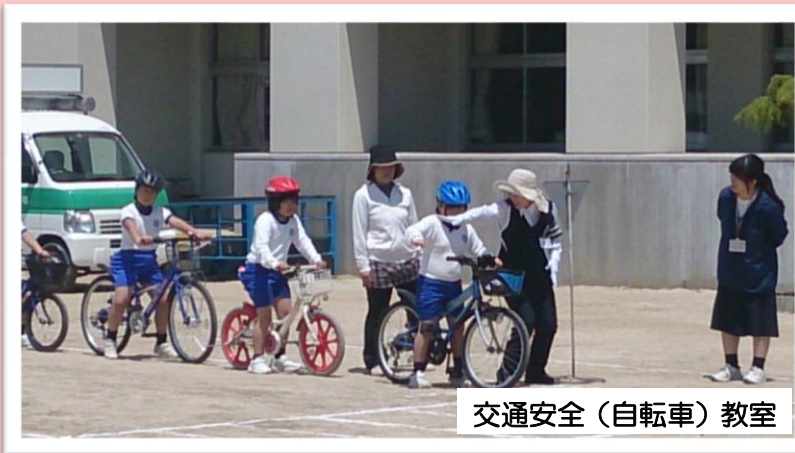
交通安全（自転車）教室