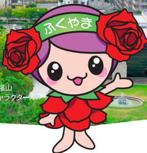
ばらのまち福山 イメージキャラクター 「ローラ」