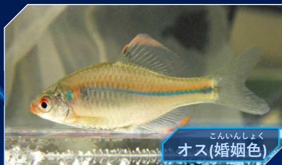
こんいんしよく オス(婚姻色)

とくちょう お の あおみどり 特徴：えらぶたから尾ひれにかけて伸びる青緑 いろ せん じゅみょう ねん 色の線があるよ。寿命は1年くらいで、 あさ ゆる なが す 浅くて緩やかな流れが好きだよ。オスは はんしよくき からだ こんいんしよく あらわ 繁殖期になると体に婚姻色が現れるよ。