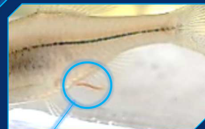
さんらんかん 産卵管

はんしよくき 繁殖期になるとメスの なか の お腹から伸びてくるよ。 しゃしん なが 写真よりも長くなって にまいがい さんらん 二枚貝に産卵するんだ。