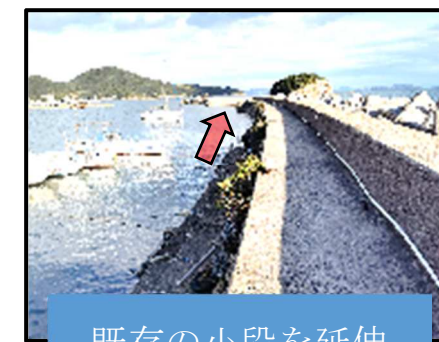
既存の小段を延伸