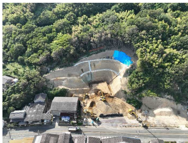
山側トンネル（御幸地区）工事状況（10月3日現在）

御幸地区のトンネル工事については、先月に引き続き、地山の掘削と鉄鋼グラウンドにおいて仮設備の工事を行っております。今月中には掘削も完了し、その後、法面保護やトンネル出入口付近の仮設備の工事を行う予定です。