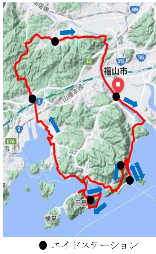
● エイドステーション