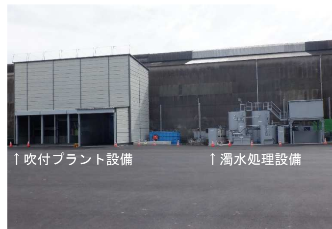
鉄鋼グラウンド仮設備工事状況（10月12日現在）