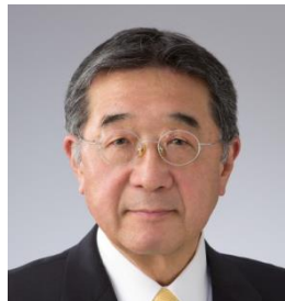
教育長職務代理者 金 仁洙