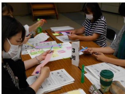
子育てサポーターリーダー 養成講座の様子

感染症対策の工夫をした講座の開催だけでなく、オンライン等を活用するなかで、引き続き地域で活動する人材の育成や、住民同士のつながりをつくるよう工夫し、学習成果を地域で活かせる環境づくりに努める。