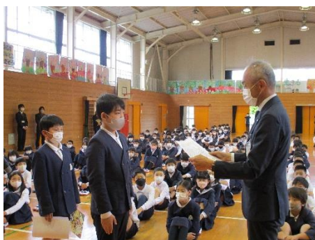
福山学校元気大賞授賞式の様子