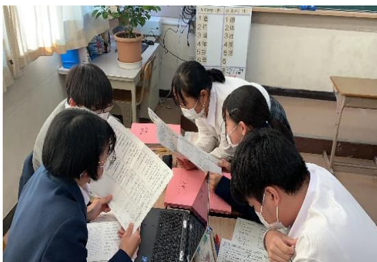
一斉研修での授業の様子

また、第三次教育振興基本計画の策定に当たり、数値による結果と変容・伸びといった過程の両面から、評価・改善できるよう、取組の評価指標を見直した。