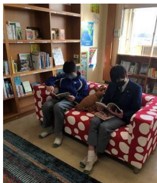
学校図書館の様子

子ども主体の学びを促し、質の高い教育活動を展開するため、学校規模・学校配置の適正化、学校施設・設備の機能の充実等、環境整備を進めていく。また、引き続き、通学路の安全確保や避難訓練の実施などを通して安心・安全対策を充実させるとともに、教育上特別な配慮を必要とする子ども一人一人の状況に応じた支援の充実を図る。