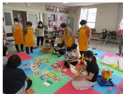
「親プロ」講座実施の様子