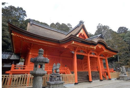
重要文化財吉備津神社本殿 修理完成後