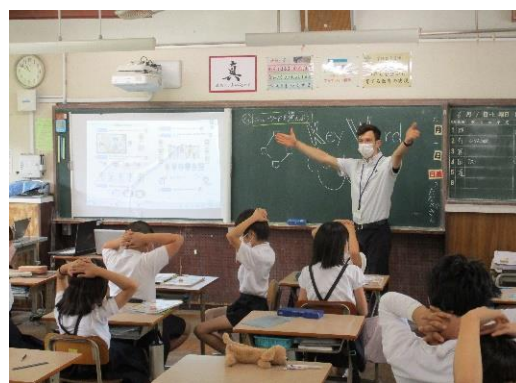
外国語活動の様子