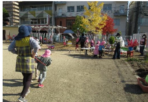
市立大学附属こども園 公開研究会