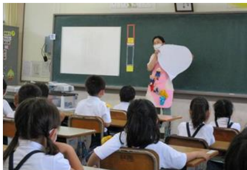
幼保小連携 (就学前施設の先生が1年生の教室で授業)