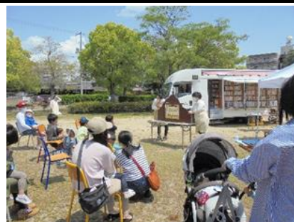
屋外でのおはなし会の様子