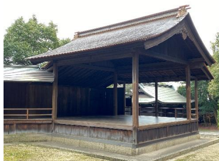
重要文化財沼名前神社能舞台 修理完成後