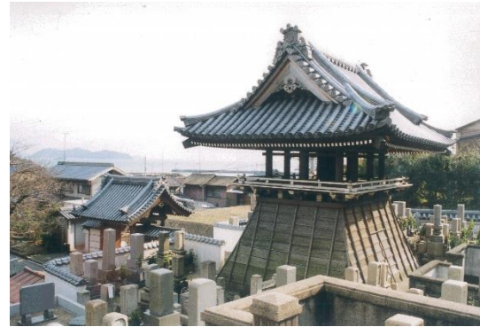
市指定重要文化財

「瀬戸の夕凧が包む 国内随一の近世港町 ～セピア色の港町に日常が溶け込む鞆の浦～」