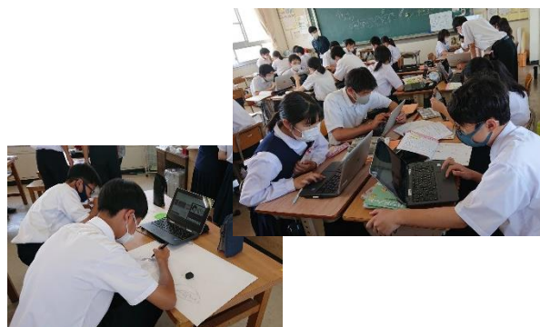
I C T教育機器を活用した授業の様子