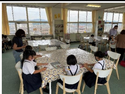
放課後子ども教室の様子（塗り絵）