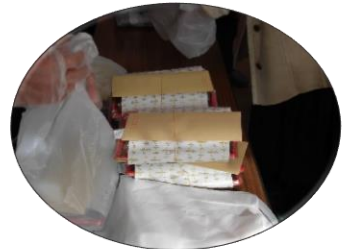
高齢者支援活動 (民生委員による友愛弁当配布)