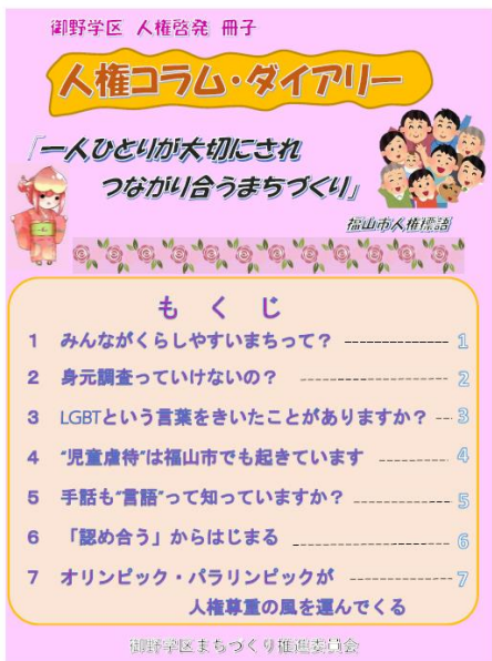
人権啓発推進事業 (人権啓発冊子学区全戸配布)