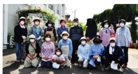
関係者のみなさん