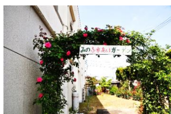
つるばら「ゼフェリーヌ・ドルーアン」