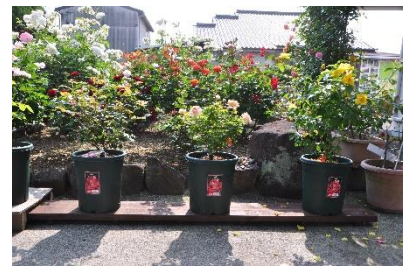
公衆衛生活動 ↑ (公民館ばら花壇整備) ← (公民館だよりで紹介)