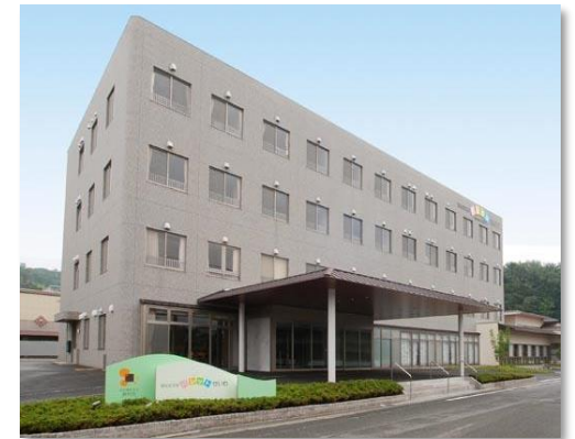
府中事務所／パレットせいわ