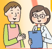
社会福祉事業者(社会福祉法人等)